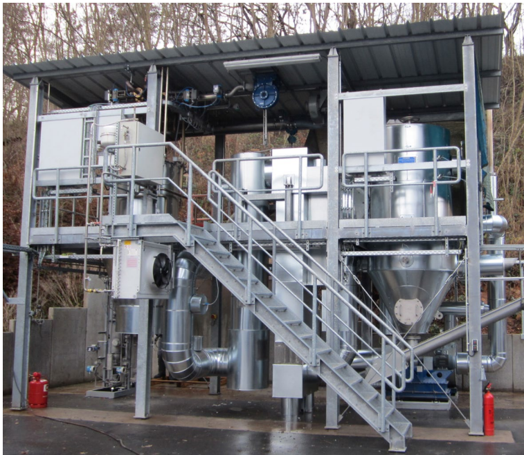
Abb. 1: Pilotanlage zur energetischen Nutzung feinkörniger Produktionsreststoffe in Gerstungen

Die Entsorgung von Lackpulver oder Schleifstäuben als Abfall ist teuer. Feinkörnige Produktionsreststoffe können jedoch energetisch genutzt werden. Beim Lackieren von Autoteilen entsteht viel Abfall, denn lediglich ein Bruchteil der Farbe landet auf der Autokarosserie, der Rest wird abgesaugt. Nur begrenzte Anteile dieser Restfarbe können wiederverwendet werden. Eine Anlage, die Forscher vom Fraunhofer-Institut für Fabrikbetrieb und -automatisierung IFF in Magdeburg zusammen mit der MBG Metallbeschichtung Gerstungen GmbH entwickelt haben, verwertet alle brennbaren pulverförmigen Industrieabfälle thermisch. An einem Referenzstandort ließen sich 25 Prozent des Erdgases, das üblicherweise zum Heizen verwendet wird, einsparen – und zudem 100 Prozent der Entsorgungskosten.