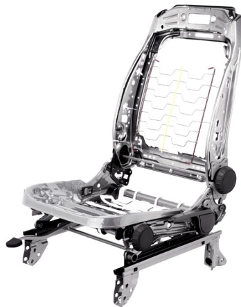
Abb. 2: Die Blechteile einer solchen Frontsitz-Struktur werden ressourceneffizient umgeformt

Für die Unterkonstruktionen von Fahrzeugsitzen werden verschiedene metallische Werkstoffe in Form von Blechen verarbeitet, die gestanzt und anschließend umgeformt werden. Damit das Umformen reproduzierbare Ergebnisse liefert, werden die Coils oder Blechteile gleichmäßig mit Verarbeitungsölen benetzt. Für ein neues Sitzmodell von BMW wäre der Bearbeitungsaufwand gestiegen.